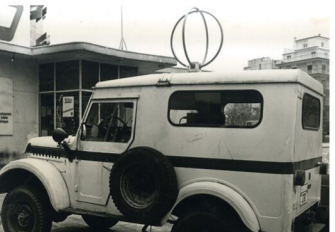
Κινητό ραδιογωνιόμετρο (radio direction finder - RDF)

Οι ραδιοπειρατές είναι χομπίστες, δημιουργούν δηλαδή, σταθμούς και εκπομπές για την προσωπική τους ευχαρίστηση, χωρίς οικονομικό όφελος. Η παρουσία τους στα ερτζιανά και η αντισυμβατικότητα τους, προκαλεί βεβαίως έκρηξη της δημοτικότητας τους και λειτουργεί ως μαγνήτης για το αντίθετο φύλο, κάτι που αποτελεί τεράστιο κίνητρο. Ξοδεύουν αρκετά χρήματα για την κατασκευή και τη συντήρηση των σταθμών τους και αυτό ωθεί πολλούς στο να καταφεύγουν σε διαφημίσεις (οικόπεδα, μαγαζιά της γειτονιάς κτλ) για να καλύψουν τα έξοδα τους.